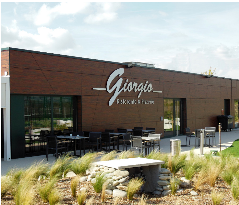
ARCHITECTE : MARTINEZ ARCHITECTURE